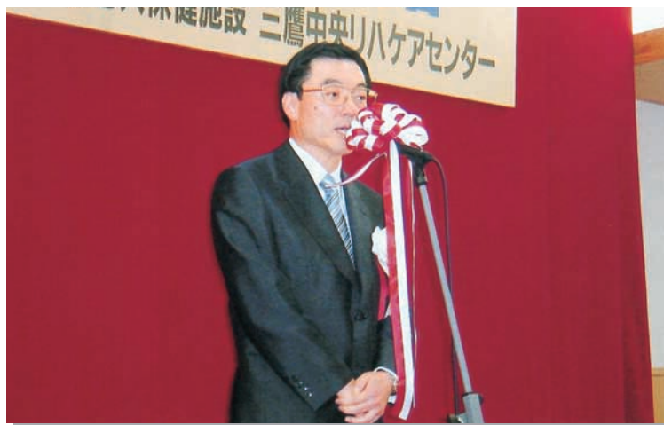
三鷹中央リハケアセンター 竣工披露式 理事長挨拶